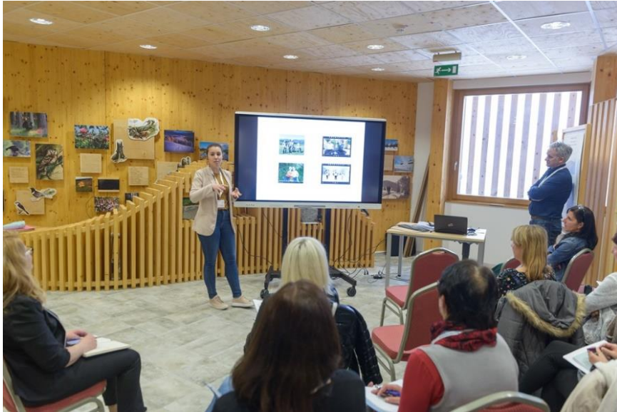
Slika 1: SPIP 2019